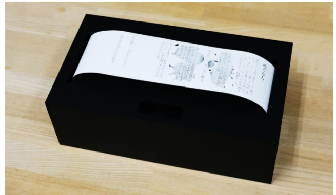
図 1 LooPrinter

プロトタイプでは、制御のしやすさから、サーマルプリンタ (SparkFun COM-10438) を使用した。このため使用する紙は感熱紙であり、印刷は白黒である。また、一つの装置としてまとめるため、コンピュータに Raspberry Pi を使用した。