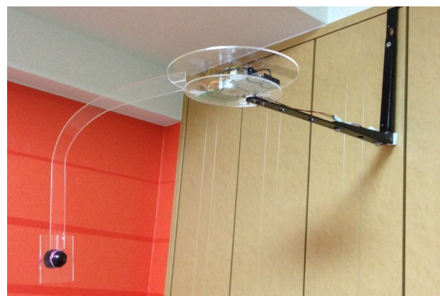
図1 Satellite Eyesの概観

システムの構成を図2に示す。Satellite Eyesはモータ、コントローラ、カメラ、タッチディスプレイから構成される。モータは360度無限回転し、カメラはユーザを捉える向きに固定される。カメラの映像はユーザの正面に置かれたタッチディスプレイ上に表示される。ユーザは画面を操